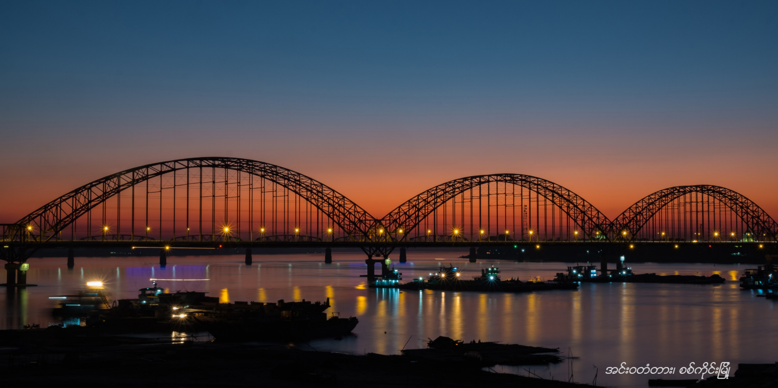
အင်းဝတံတား၊ စစ်ကိုင်းမြို့

အဓိကကျသော စီးပွားရေးဆိုင်ရာ စည်းကမ်းချက်များအပေါ် သဘောတူညီမှုရသည်နှင့် တစ်ပြိုင်နက် ရင်းနှီးမြှုပ်နှံသူများအနေဖြင့် ဆက်လက်ဆောင်ရွက်နိုင်ရန် ဥပဒေအရ စည်းနှောင်မှုရှိသော ကတိကဝတ်ပြုမှုမျိုးကို တတ်နိုင်သမျှ အလျင်အမြန် ချုပ်ဆိုသင့်ပါသည်။ သေချာပြီးသား သဘောတူညီမှုအခိုက်အတန့်ကို ဆိုင်းငံ့ထားခြင်းသည် အကျိုးမရှိနိုင်ပါ။